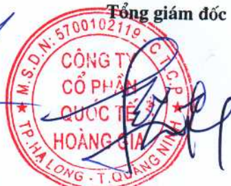
Đỗ Trí Vỹ